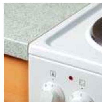
Instalace bez mezery mezi kuchyňskou linkou a sporákem