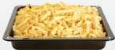
Největší plech - MAXI 7,5 l