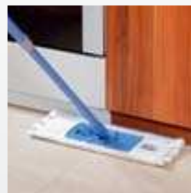
Praktický sokl nepřekáží umývání podlahy