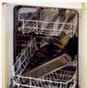
Nové příslušenství - hluboký plech je možno vkládat do myčky (i 45 cm) nebo do dřezu