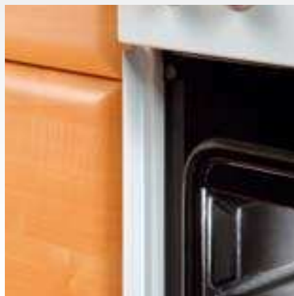
Lišta chrání linku před horkým vzduchem