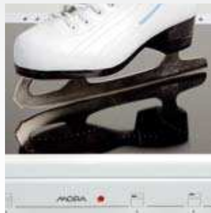
Sklokeramická deska je rovná a hladká