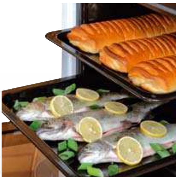
Multifunkční trouba 55L