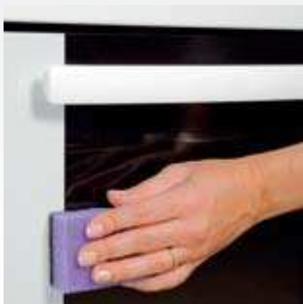
Snadné čištění skla