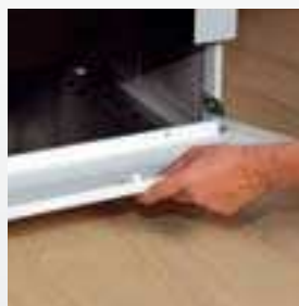
Zásuvka/ Sklopná dvířka