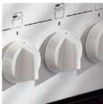
Nové ergonomické knoflíky